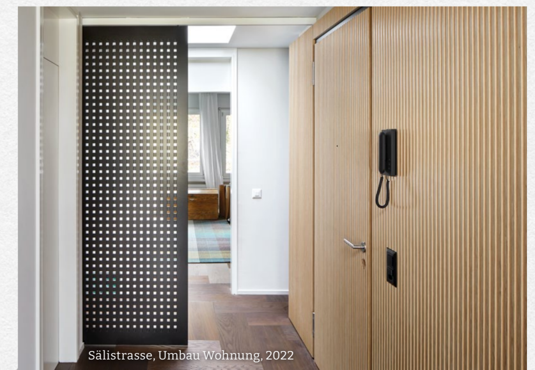
Sälistrasse, Umbau Wohnung, 2022

Roland Engel Roland Engel Architektur GmbH, Luzern