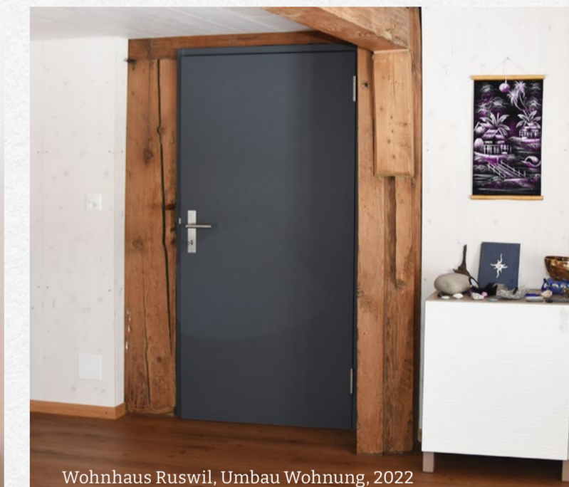
Wohnhaus Ruswil, Umbau Wohnung, 2022