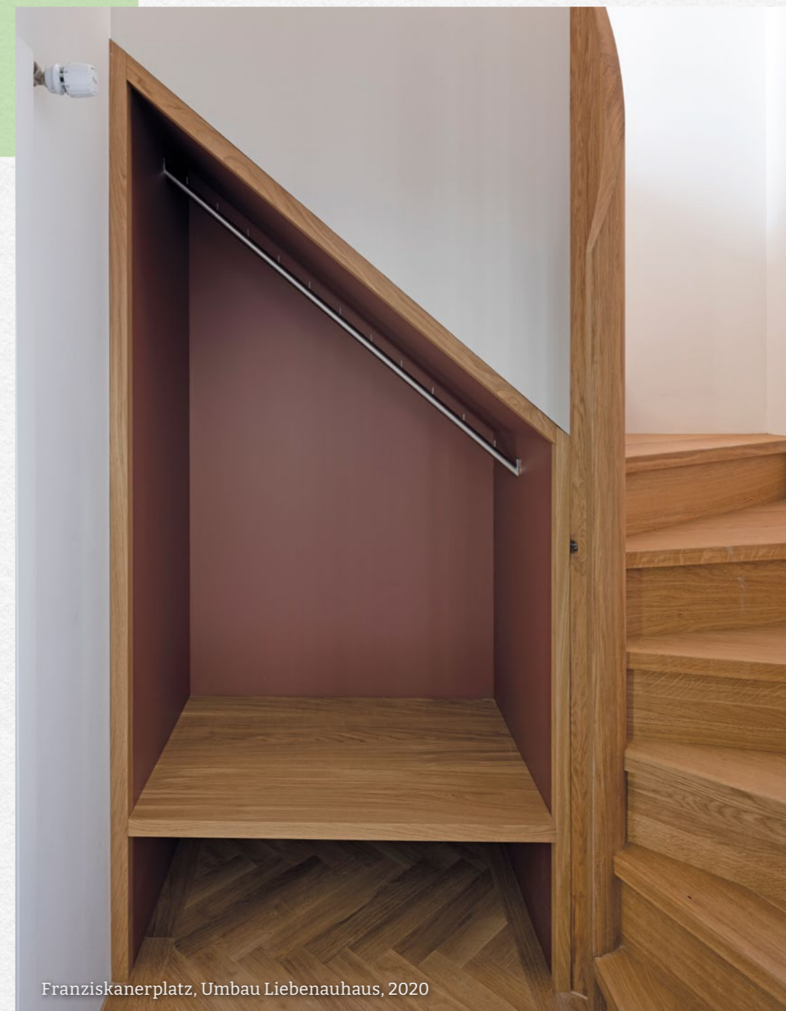
Franziskanerplatz, Umbau Liebenauhaus, 2020