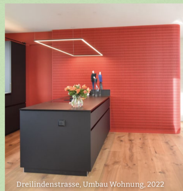
Dreilindenstrasse, Umbau Wohnung, 2022