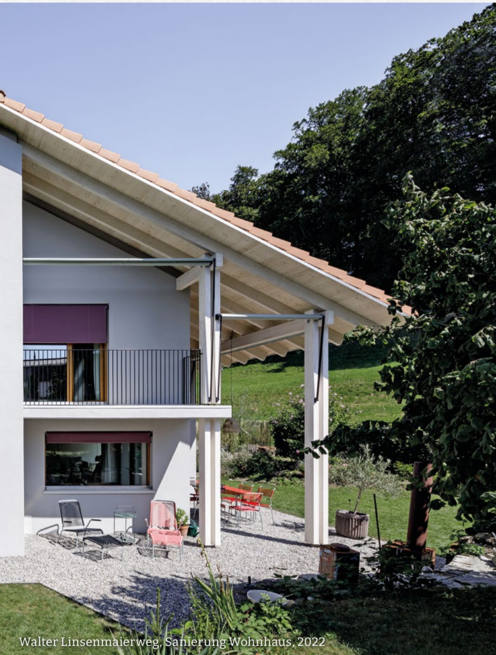
Walter Linsenmaierweg, Sanierung Wohnhaus, 2022