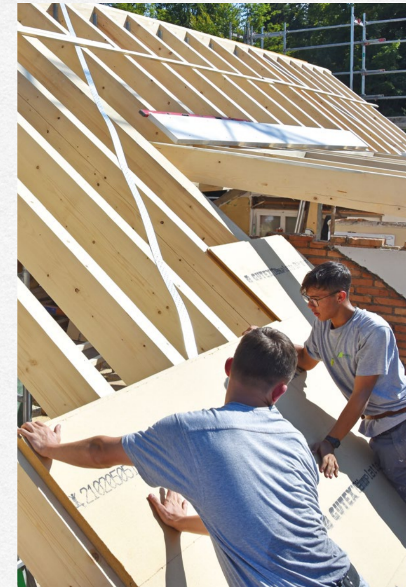
Steinhofstrasse, Dacherneuerung, 2022

Manchmal sehen wir die Welt von oben. Häufig haben wir Einblick in Häuser, die anderen verborgen bleiben. Immer entdecken wir Neues und Interessantes. Unsere Fachleute sind Profis, wenn es darum geht, historische Gebäude und denkmalgeschützte Bauwerke zu erhalten und zu sanieren. Wir pflegen ein freundschaftliches Verhältnis mit unseren oft langjährigen Kundinnen und Kunden wie auch im Quartier. Als starker Partner engagieren wir uns lokal für das Luzerner Theater, das Blues Festival und diverse soziale Wohnbaugenossenschaften. Wir gestalten unsere Umgebung aktiv mit. Denn wir sind mitten in Luzern zuhause und fest in Stadt und Agglomeration verwurzelt.