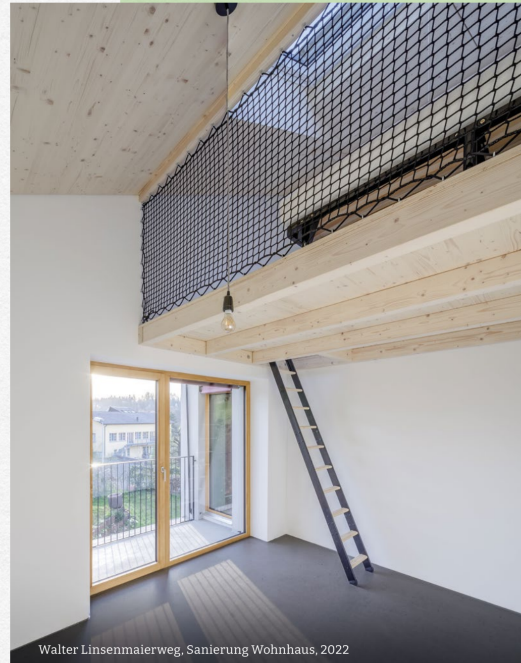
Walter Linsenmaierweg, Sanierung Wohnhaus, 2022