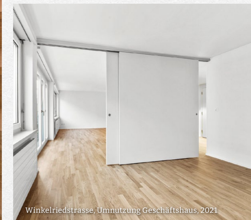
Winkelriedstrasse, Umnutzung Geschäftshaus, 2021