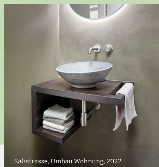
Sälistrasse, Umbau Wohnung, 2022