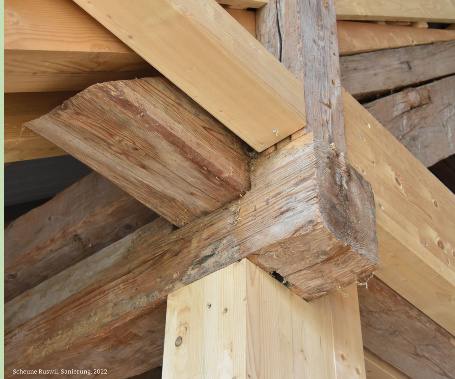
Scheune Ruswil, Sanierung, 2022

Wir beobachten, hinterfragen, gehen auf Wünsche ein und suchen optimale Lösungen. Damit das gelingt, braucht es Vertrauen, Wertschätzung, Offenheit und Transparenz. Diese Werte leben wir. Miteinander gehen wir für unsere Kundinnen und Kunden jeden Extrameter.